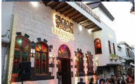
العشاء بدمشق القديمة مطعم الدورادو