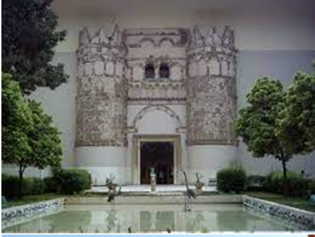
زيارة المتحف الوطني