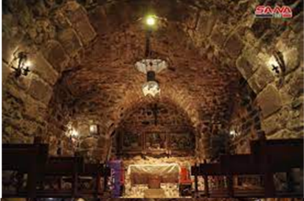
زيارة كنيسة حناينا