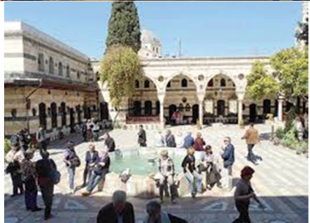
زيارة قصر العظم