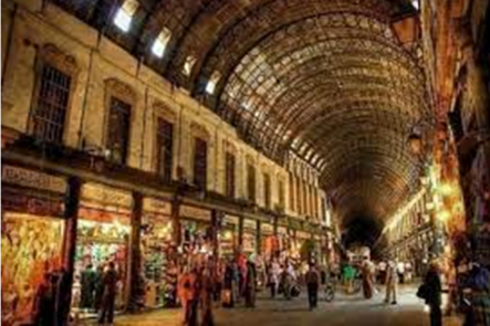
زيارة سوق مدحت باشا