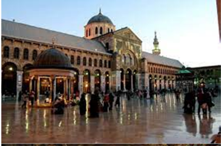
زيارة الجامع الاموي