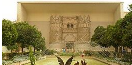
Musée National de Damas.

Le Musée National de Damas est le principal musée archéologique de Damas et l'un des plus importants de Syrie. Il est situé dans les quartiers ouest de la ville, entre l'université de Damas et le complexe religieux de la Tekkiye du Sultan Selim