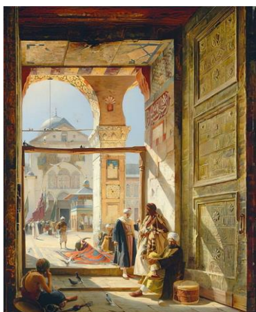
G. Bauernfeind- Porte d'entrée de la Grande Mosquée des Omeyyades - 1890.

Omar Youssef Souleyman- Poète damascène- extrait du recueil Loin de Damas .